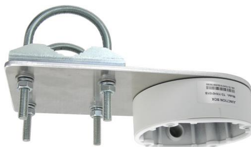
DKH12 + 2x UA70 + TDYXH0101B